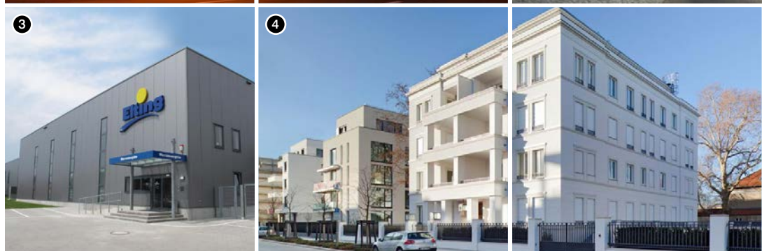
4. Wohnanlage Diplomatenviertel Tiergarten - Berlin, Deutschland.