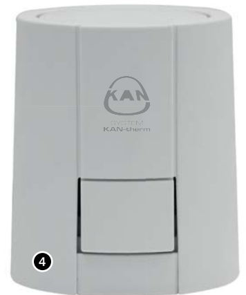
4. Stellantrieb Premium 2.

Die Stellantriebe werden mittels Kunststoffadapter an den Thermostatventilen montiert.