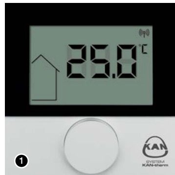
1. Raumthermostat Funk Premium 2 mit LCD.