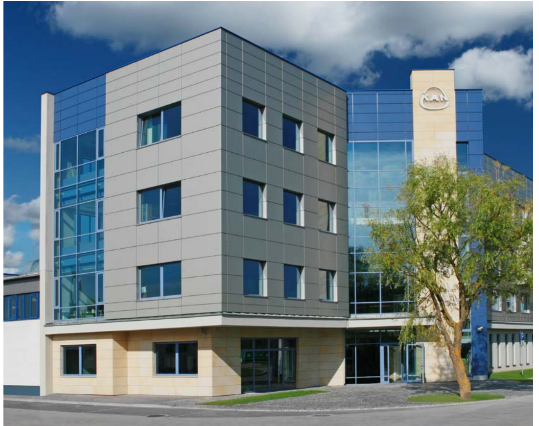
Hauptsitz der Firma KAN.