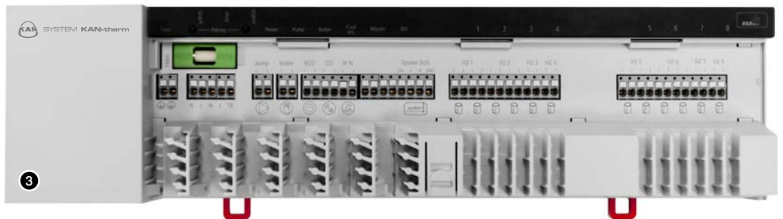
3. Regelklemmleiste Funk mit LAN-Anschluss.