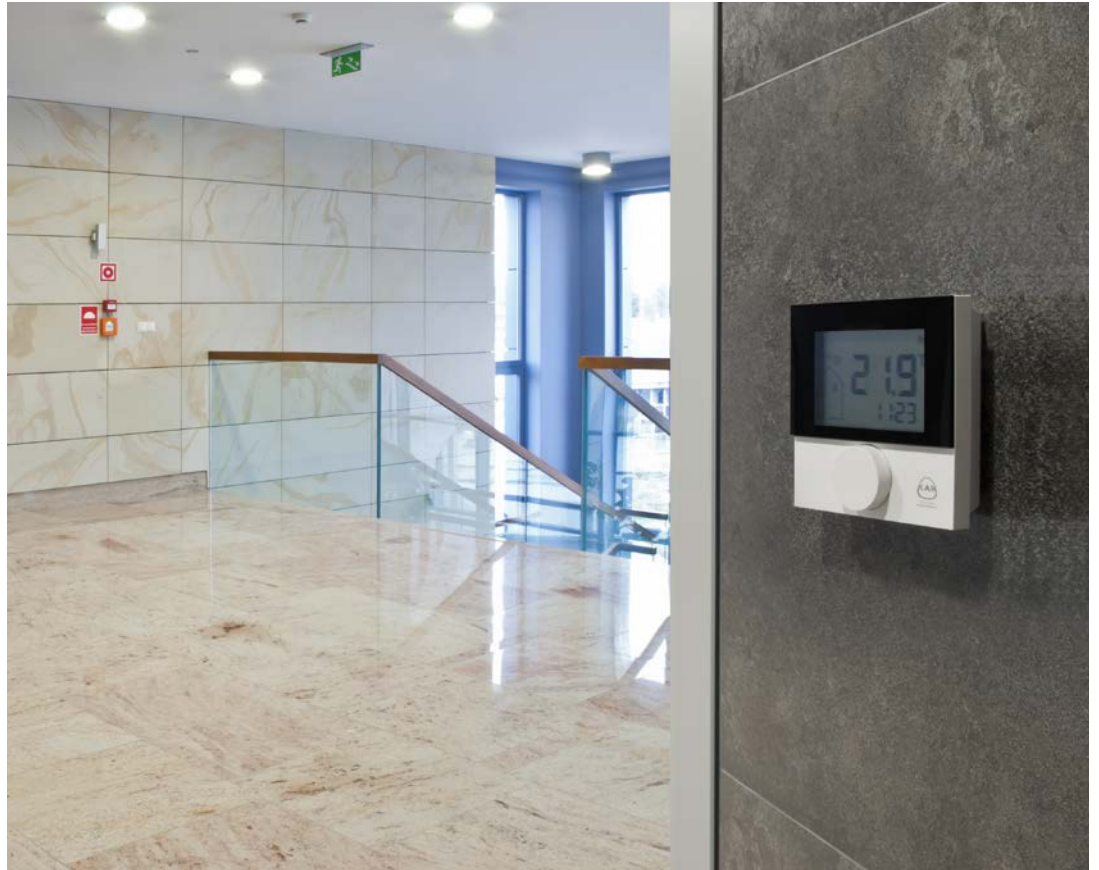
1. Porsche Zentrum „Niederrhein“ - Moers, Deutschland.