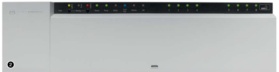
2. Regelklemmleiste Funk mit LAN-Anschluss.

Die Leiste verfügt über einen Internet-Anschluss (LAN), mit der das gesamte Steuersystem ans Heimnetzwerk angeschlossen werden kann. Die Web-basierte mehrsprachige Anwendung „KAN-therm EZR-Home Manager“ bietet dem Nutzer eine bequeme und intuitive Verwaltung des Steuersystems über PC, Tablet und Smartphone.